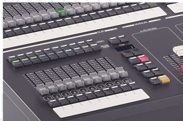
キースイッチにバックライトを採用 サブフェーダの保存モードに応じて色が変わる。