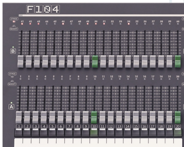
従来の操作性を継承し、 利便性に優れたプリセットフェーダ